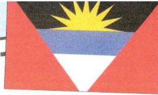
Antigua & Barbuda